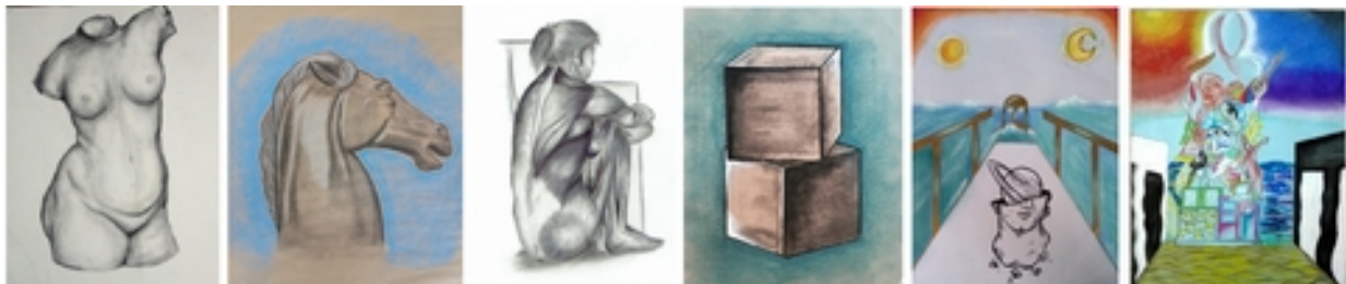
Expressió de la subjectivitat

Encaix i proporció, reinterpretació d'obres de grans mestres.